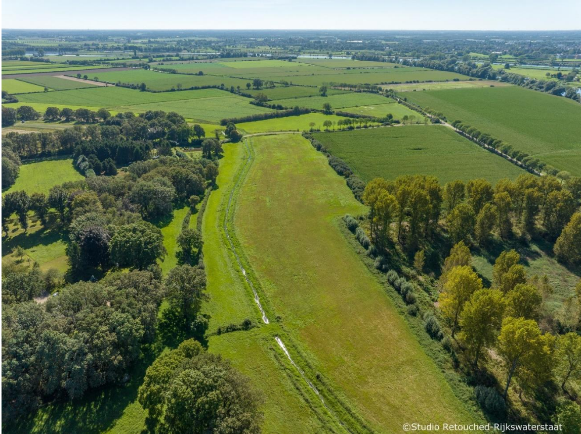
Een deel van het maatregelgebied Geul Ossenkamp en Monding Heijense Leijgraaf, van noord naar zuid gezien, met bovenaan de Maas nog net zichtbaar.

In deze uiterwaard van de Maas waren ooit geïsoleerde kwelgeulen een karakteristiek element. Die werden gevoed door helder en mineraalrijk grondwater (kwel), dat afstroomt vanuit de naastgelegen terrassen en bijzondere waternatuur met zich mee brengt. Daarom wordt ook gekeken of er kansen zijn om kwelgeulen terug te brengen in het landschap. Met name de zuidkant van de Heijense Leijgraaf ter hoogte van Afferden lijkt hiervoor goede mogelijkheden te bieden.