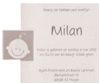
Nieuwe aanwinsten in Heijen ...