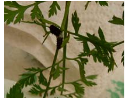
2. Rups na eerste vervelling. Het is een zwarte rups met een wit stukje in het midden. Zo lijkt hij op een vogelpoepje; Goede camouflage dus!