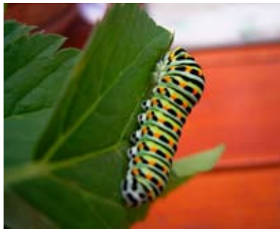
3. De rups vervelt zo nog 5 -6 keer totdat hij er zo kleurrijk uitziet en klaar is om te verpoppen.