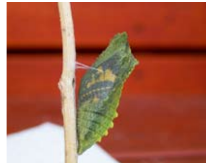
4. Pop. Gordelpop genoemd vanwege het "gordeltje" waarmee hij vast zit aan het takje. Zo overwintert hij...