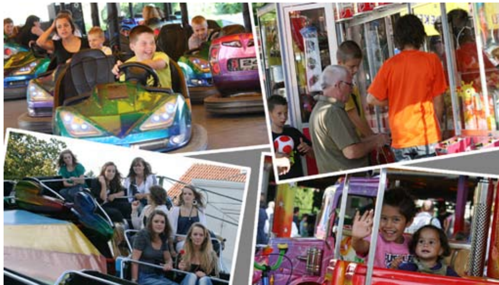
Vrolijke gezichten op de kermis

In de maanden dat ons blad nu uitgegeven is hebben wij meerdere malen en van verschillende kanten de suggestie gekregen of er een soort van vraag en aanbod pagina te realiseren is.